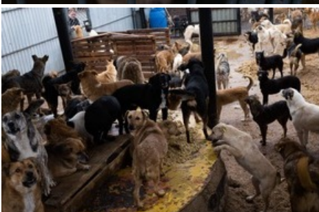
Hunde im Tierheim.