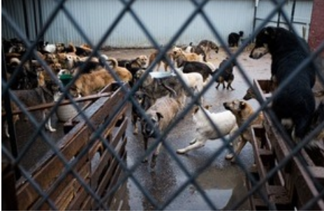
Überfülltes Tierheim.

Diese Meldung kann unter https://www.presseportal.ch/de/pm/100004691/100862178 abgerufen werden.