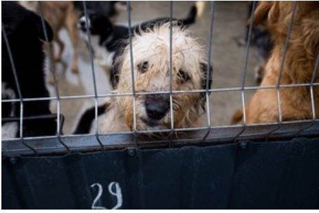
Ein Streuner.