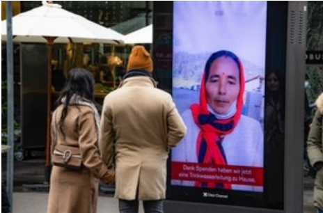
PR-Stunt: Passanten nehmen unbekanntem Anruf aus der Ferne entgegen