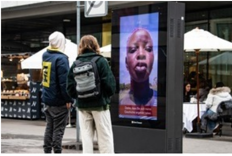
PR-Stunt: Passanten nehmen unbekanntem Anruf aus der Ferne entgegen