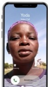
Sie haben einen Anruf aus Burkina Faso - Kampagnenvisual

Diese Meldung kann unter https://www.presseportal.ch/de/pm/100062485/100862212 abgerufen werden.