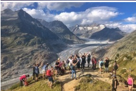
2. Mountain Glow Yoga-Festival am grössten Gletscher der Alpen 2.9.-5.9.2021