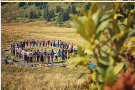
2. Mountain Glow Yoga-Festival am grössten Gletscher der Alpen 2.9.-5.9.2021