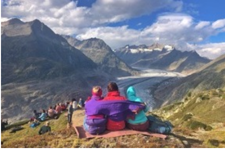
2. Mountain Glow Yoga-Festival am grössten Gletscher der Alpen 2.9.-5.9.2021