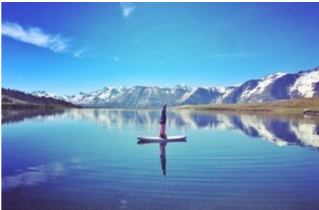
2. Mountain Glow Yoga-Festival am grössten Gletscher der Alpen 2.9.-5.9.2021