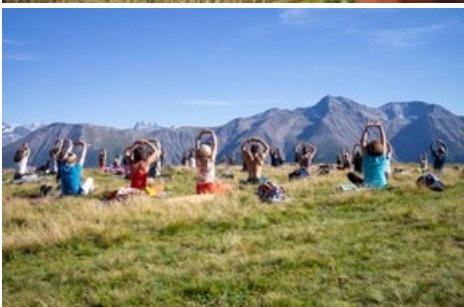
2. Mountain Glow Yoga-Festival am grössten Gletscher der Alpen 2.9.-5.9.2021