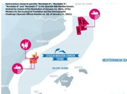
Karte mit den Anträgen im Golf von Lion vor der Küste Kataloniens und der Überlappung mit dem Walmigrations-Korridor

Diese Meldung kann unter https://www.presseportal.ch/de/pm/100000082/100863717 abgerufen werden.