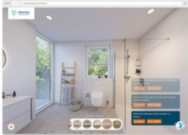
Einblick in die virtuelle Badausstellung von Viterma.