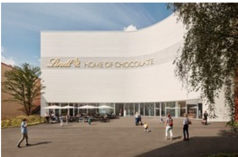
Aussenansicht des Lindt Home of Chocolate.

Diese Meldung kann unter https://www.presseportal.ch/de/pm/100018582/100865775 abgerufen werden.