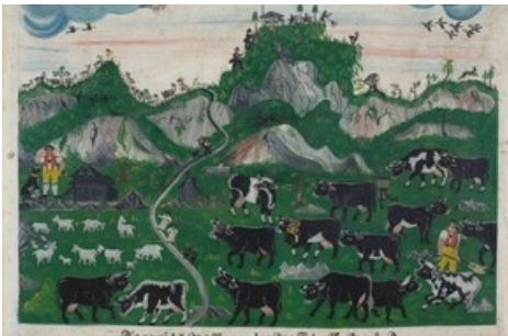
Bartholomäus Lämmli, Viehweide unter Kamor, Hohem Kasten und Staubern , 1854, überwiesen vom Historischen Museum St.Gallen 1978