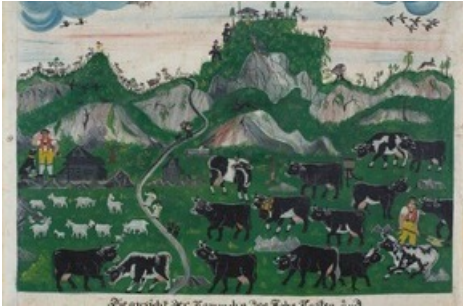
Bartholomäus Lämmli, Viehweide unter Kamor, Hohem Kasten und Staubern , 1854, überwiesen vom Historischen Museum St.Gallen 1978