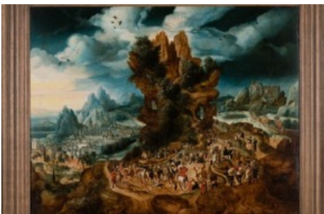
Herri met de Bles, Der Weg zum Kalvarienberg , um 1540