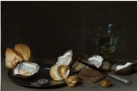
Anonymer Haarlemer Meister, Stilleben mit Austern , um 1630