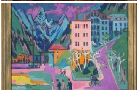
Kirchner Ernst Ludwig, Bahnhof Davos , 1925, Foto: Sebastian Stadler