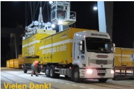
Die Post führte die Besucher virtuell durch die Paketzentren in Härkingen, Cadenazzo und Frauenfeld.