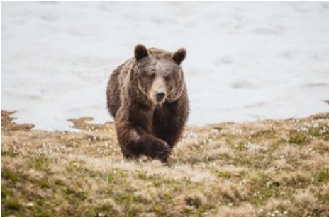
Bärin Jambolina erkundet zum ersten Mal die Natur in der Aroser Bergwelt.