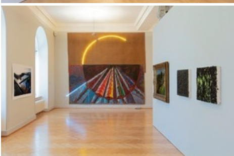
Einblicke - Ausblicke, Installationsansicht Kunstmuseum St.Gallen, Foto: Stefan Rohner