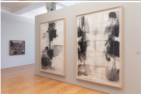
Einblicke - Ausblicke, Installationsansicht Kunstmuseum St.Gallen, Foto: Stefan Rohner