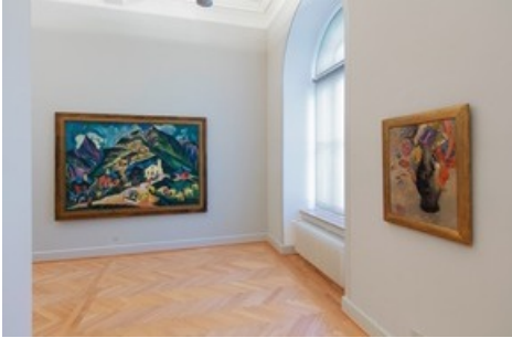
Einblicke - Ausblicke, Installationsansicht Kunstmuseum St.Gallen, Foto: Stefan Rohner