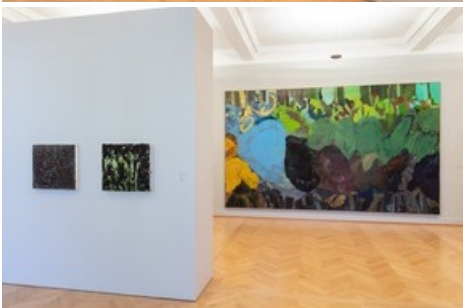
Einblicke - Ausblicke, Installationsansicht Kunstmuseum St.Gallen