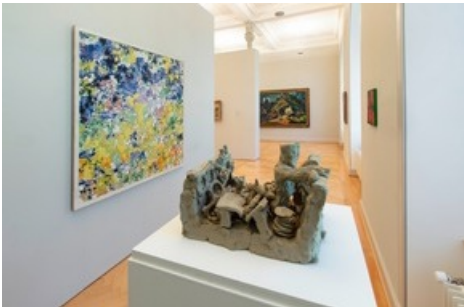
Einblicke - Ausblicke, Installationsansicht Kunstmuseum St.Gallen, Foto: Stefan Rohner

Diese Meldung kann unter https://www.presseportal.ch/de/pm/100059306/100872053 abgerufen werden.