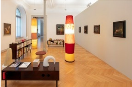
Einblicke - Ausblicke, Installationsansicht Kunstmuseum St.Gallen