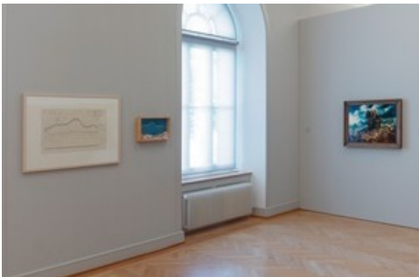
Einblicke - Ausblicke, Installationsansicht Kunstmuseum St.Gallen, Foto: Stefan Rohner