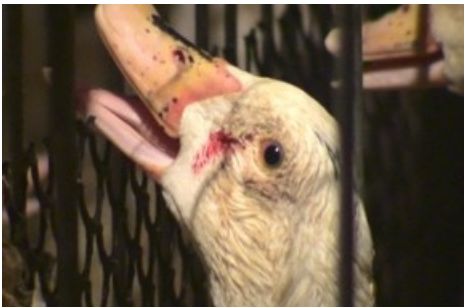
Die Realität der Stopfmastindustrie.

Diese Meldung kann unter https://www.presseportal.ch/de/pm/100004691/100872836 abgerufen werden.