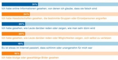
Erfahrungen der Kinder mit problematischen Inhalten während des Lockdowns