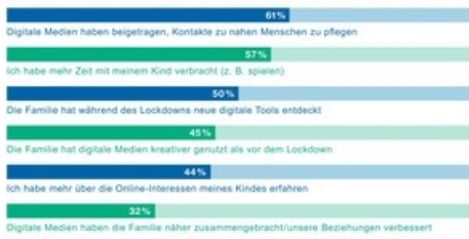
Von Eltern wahrgenommene Vorteile digitaler Medien während des Lockdowns