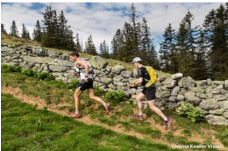
Trailrunning am Pizol