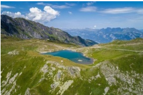
Wangsersee - Pizol