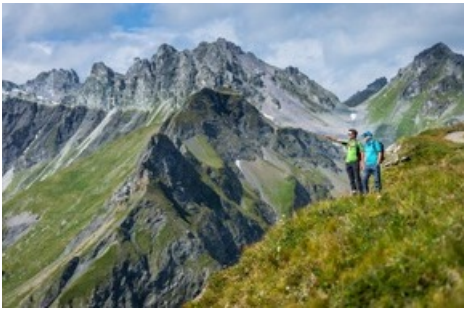
Panorama Höhenweg am Pizol