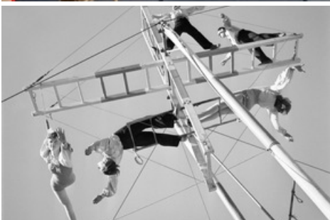
Bildlegende: Artistennummer im Freilichtzirkus Arena Pilatus in Luzern, April 1942.