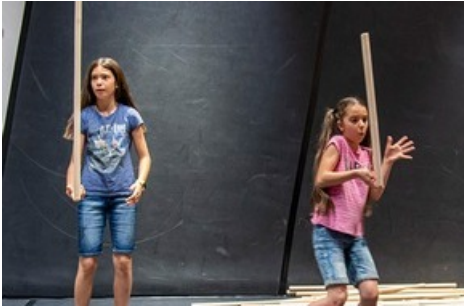
Wie lange könnt ihr einen Stab balancieren? Findet es heraus auf der Spielfläche in der Ausstellung.