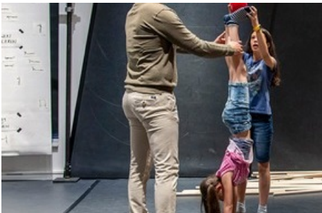
Die ganze Familie im Gleichgewicht: Balance-Übungen laden zum Ausprobieren ein.