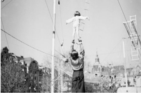
Bildlegende: Artistennummer im Freilichtzirkus Arena Pilatus in Luzern, April 1942