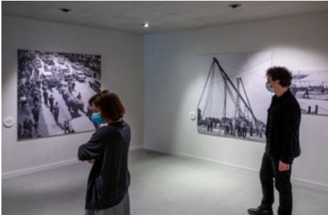
Eine Revue von Pressebildern gewährt Einblick in das Zirkusleben vor und hinter den Kulissen vor 50 Jahren.