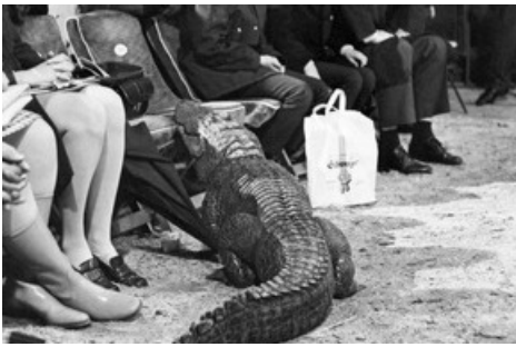
Bildlegende: Krokodil und Zuschauer im Zirkus Knie in Rapperswil, 1969.