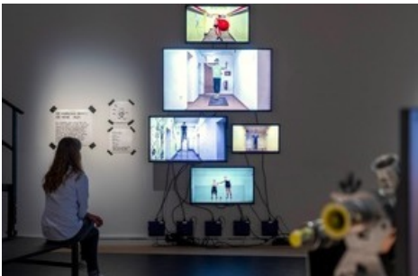
Langzeitpraxis: Das Werk the Hour zeigt, wie ausdauernd Zirkusartist*innen üben