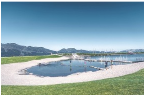
BILD zu OTS - BILD zu OTS - Das Wasser so klar wie die Bergluft, die Kulisse so malerisch wie in einer Fabelwelt. Mit Sprungturm, Schwimminsel und SUP-/Bootsverleih schreit der Fichtensee förmlich nach einem Hechtsprung ins kristallklare, knapp 14 Meter tiefe Wasser. Der Fichtensee ist nicht nur ein wunderbarer Ort, um anzukommen. Er ist auch ein idealer Ausgangspunkt, um loszuwandern!

BILD zu OTS - Das Wasser so klar wie die Bergluft, die Kulisse so malerisch wie in einer Fabelwelt. Mit Sprungturm, Schwimminsel und SUP-/Bootsverleih schreit der Fichtensee förmlich nach einem Hechtsprung ins kristallklare, knapp 14 Meter tiefe Wasser. Der Fichtensee ist nicht nur ein wunderbarer Ort, um anzukommen. Er ist auch ein idealer Ausgangspunkt, um loszuwandern!