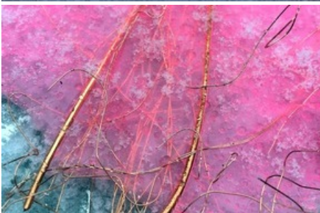
Martina Morger, So Long , Objekte aus Silikon, 2020