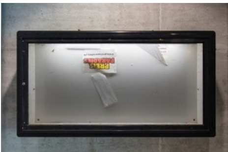
Martina Morger, Passage , 2020, Courtesy die Künstlerin, Foto: Stefan Rohner