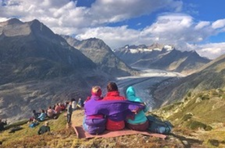
2. Mountain Glow Yoga-Festival am grössten Gletscher der Alpen 2.9.-5.9.2021