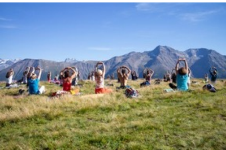
2. Mountain Glow Yoga-Festival am grössten Gletscher der Alpen 2.9.-5.9.2021