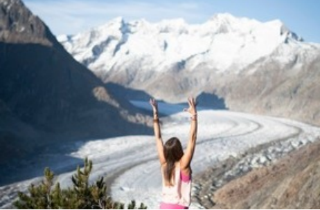
Yoga mit Blick auf den Grossen Aletsch Gletscher Im Bild die Initiatorin Karin Bittel. Wir glauben ihr auf's Wort, wenn sie verspricht: „Es wird magisch!“