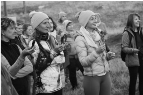
2. Mountain Glow Yoga-Festival am grössten Gletscher der Alpen 2.9.-5.9.2021

Diese Meldung kann unter https://www.presseportal.ch/de/pm/100070233/100874767 abgerufen werden.