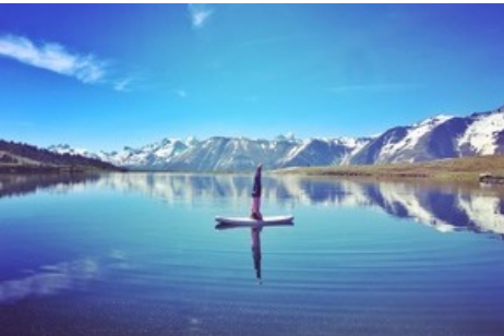
2. Mountain Glow Yoga-Festival am grössten Gletscher der Alpen 2.9.-5.9.2021