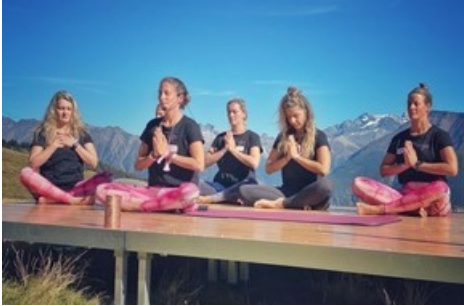
2. Mountain Glow Yoga-Festival am grössten Gletscher der Alpen 2.9.-5.9.2021