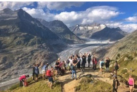
2. Mountain Glow Yoga-Festival am grössten Gletscher der Alpen 2.9.-5.9.2021