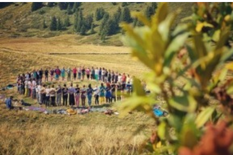
2. Mountain Glow Yoga-Festival am grössten Gletscher der Alpen 2.9.-5.9.2021