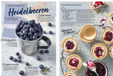
Doppelseite Backen und Süsses