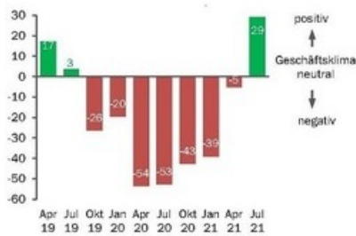
SWISSMECHANIC-Geschäftsklima-Index für KMU-MEM