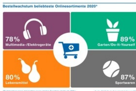
Bestellwachstum beliebteste Onlinesortimente 2020