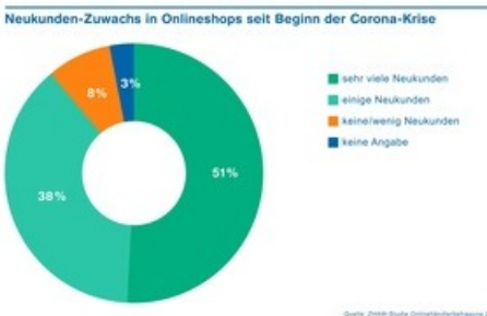
Neukunden-Zuwachs in Onlineshops seit Beginn der Corona-Krise