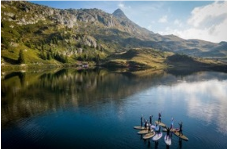
2. Mountain Glow Yoga-Festival am grössten Gletscher der Alpen