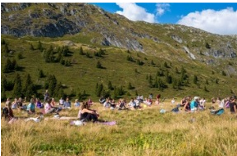
2. Mountain Glow Yoga-Festival auf Bettmeralp 2.9.-5.9.2021