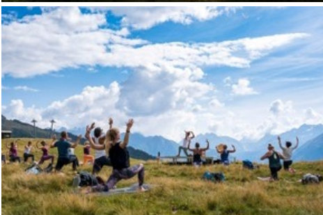
2. Mountain Glow Yoga-Festival auf Bettmeralp 2.9.-5.9.2021