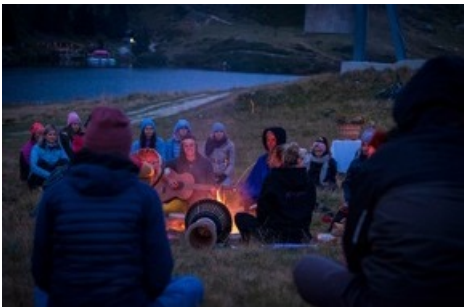
2. Mountain Glow Yoga-Festival auf Bettmeralp 2.9.-5.9.2021

Diese Meldung kann unter https://www.presseportal.ch/de/pm/100070233/100877360 abgerufen werden.