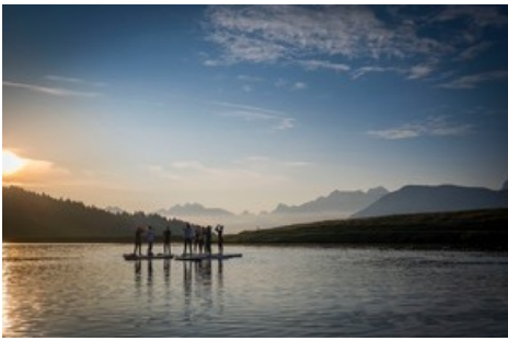
2. Mountain Glow Yoga-Festival auf Bettmeralp 2.9.-5.9.2021