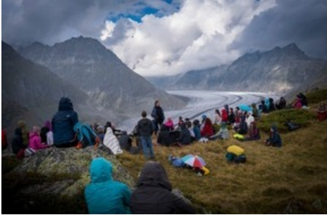
2. Mountain Glow Yoga-Festival auf Bettmeralp 2.9.-5.9.2021