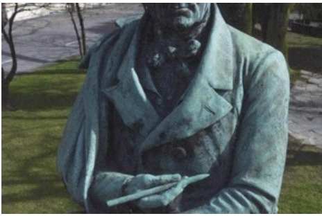
Ausgangspunkt des Rundgangs ist das Denkmal Heinrich Zschokkes im Kasinopark in Aarau

Diese Meldung kann unter https://www.presseportal.ch/de/pm/100085663/100877903 abgerufen werden.