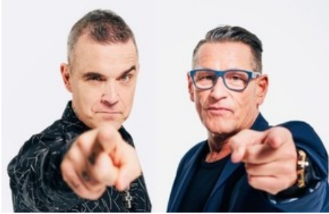
BILD zu OTS - ROBBIE WILLIAMS und KLAUS LEUTGEB (CEO von Leutgeb Entertainment Group)