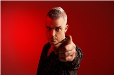
BILD zu OTS - Pressefoto Robbie Williams 2021

Diese Meldung kann unter https://www.presseportal.ch/de/pm/100063570/100878698 abgerufen werden.