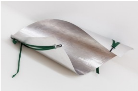
Marie Lund, The Apartment , 2020, Courtesy die Künstlerin und Croy Nielsen, Wien, Foto: kunst-dokumentation