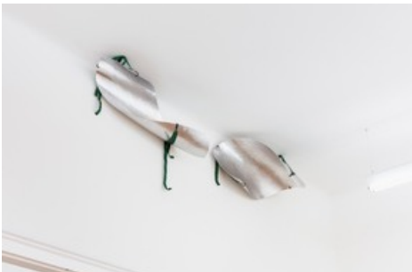
Marie Lund, Installationsansicht The Apartment , Croy Nielsen, Wien, 2020, Foto: kunst-dokumentation