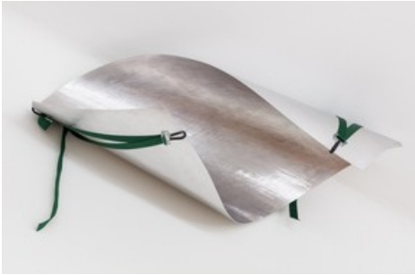
Marie Lund, The Apartment , 2020, Courtesy die Künstlerin und Croy Nielsen, Wien, Foto: kunst-dokumentation