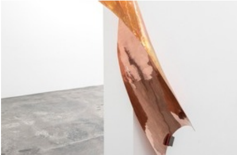
Marie Lund, The Thirst , 2019, Nicolai Wallner, Kopenhagen