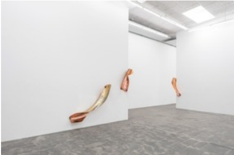
Marie Lund, The Thirst , 2019, Nicolai Wallner, Kopenhagen