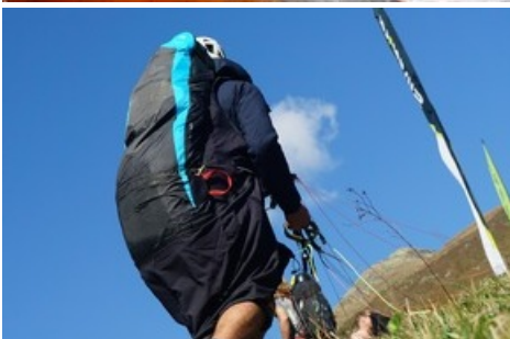
7. Rollibock-Trophy - Hike&Fly Foto (c)aletscharena.ch - flug-taxi