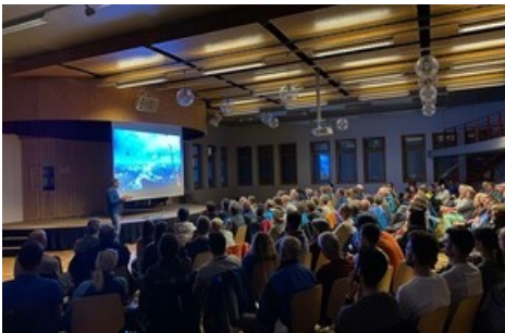
Chrigel Maurer berichtet über die Red-Bull-X-Alps und gab wertvolle Tipps.