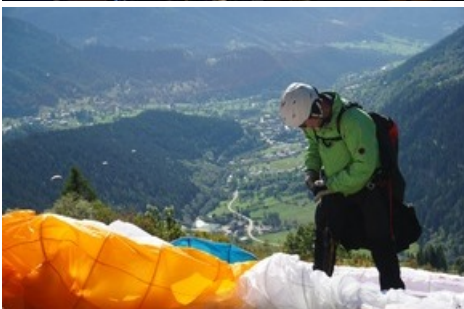
7. Rollibock-Trophy - Hike&Fly Foto (c)aletscharena.ch - flug-taxi