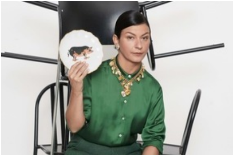
Es gibt den Ausdruck «Wirf keine Perlen vor die Säue». Das Schwein in Kombination mit der «Perle zum Essen» visualisiert dieses Sprichwort. «Honor thy Meal» gibt dem Visual dann die nötige Aussagekraft: Wertschätzung für das, was wir essen.