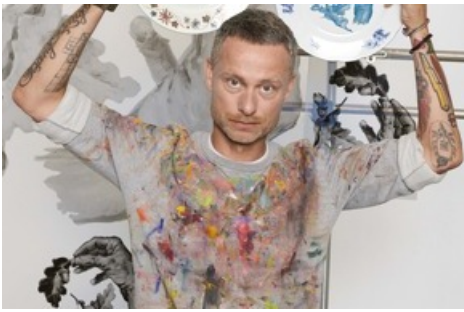
Pascal Möhlmann kreierte für die Table Ware Kollektion das Sujet der Eiche, weil diese mehrere Menschengenerationen überdauert