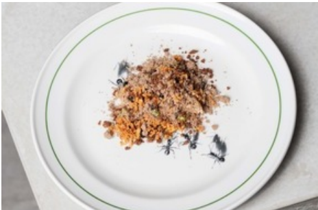
Zum Sujet der Waldameisen kreierte Nenad einen essbaren Waldboden Zwischengang „Land of Plenty“ PILZE_SAUERKLEE_TRÜFFEL_ESSBARE ERDE Sujet von Huber.Huber