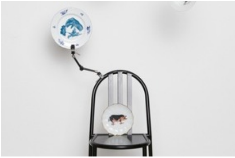
Miele lanciert SamePlateDifferent Table Ware Kollektion: Dafür wurden Teller aus dem Brockenhaus mit Siebdruck zu neuem Leben erweckt