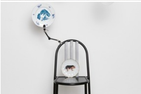
Die SamePlateDifferent Table Ware Kollektion ist ab Mitte November 2021 im Miele Online-Shop erhältlich

Diese Meldung kann unter https://www.presseportal.ch/de/pm/100010726/100879822 abgerufen werden.