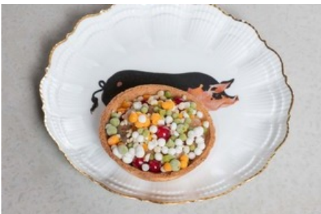
Dessert „Honor thy Meal“ TARTELETTES_SANDDORN_JOGHURT_SCHOKOLADE Sujet von Cécile Giovannini