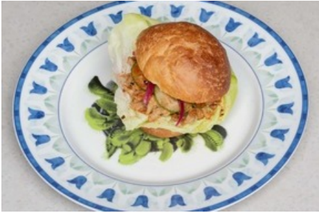
Hauptgang „Tricked Carnivores“ PFLANZLICHER BURGER_EINGELEGTES GEMÜSE_SPICY MAYO Sujet von Huber.Huber