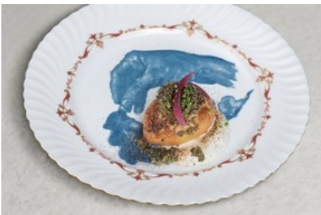
Vorspeise "A Taste of Eternity" BERG KARTOFFELN_KAVIAR DES FELDES_FERMENTIERTER KNOBLAUCH Sujet von Pascal Möhlmann