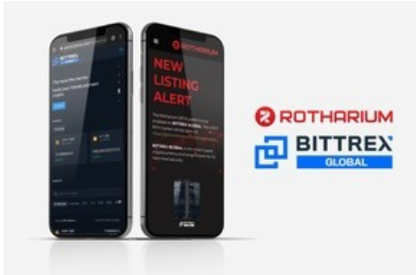
BILD zu OTS - Österreichische Kryptowährung Rotharium auf der Plattform „Bittrex Global“ erhältlich.

Diese Meldung kann unter https://www.presseportal.ch/de/pm/100087901/100879982 abgerufen werden.