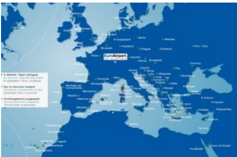
Karte der Destinationen: 70 in Europa und Mittelmeer

Diese Meldung kann unter https://www.presseportal.ch/de/pm/100075401/100880096 abgerufen werden.