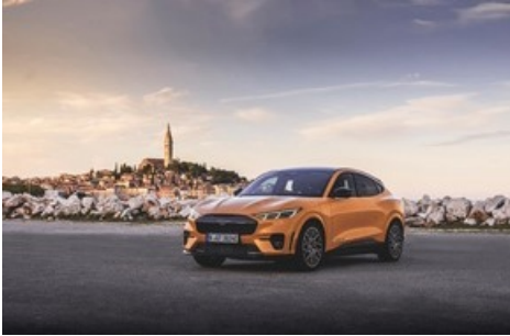
Ford Mustang Mach-E GT / Weiterer Text über ots und www.presseportal.ch/de/nr/100000451 / Die Verwendung dieses Bildes ist für redaktionelle Zwecke honorarfrei.