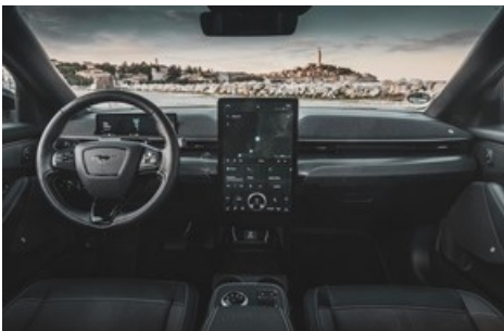
Ford Mustang Mach-E GT / Weiterer Text über ots und www.presseportal.ch/de/nr/100000451 / Die Verwendung dieses Bildes ist für redaktionelle Zwecke honorarfrei.