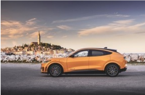
Ford Mustang Mach-E GT / Weiterer Text über ots und www.presseportal.ch/de/nr/100000451 / Die Verwendung dieses Bildes ist für redaktionelle Zwecke honorarfrei.