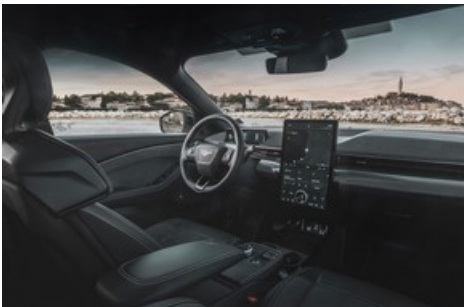
Ford Mustang Mach-E GT / Weiterer Text über ots und www.presseportal.ch/de/nr/100000451 / Die Verwendung dieses Bildes ist für redaktionelle Zwecke honorarfrei.