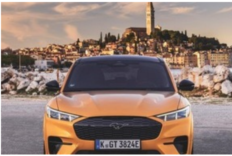
Ford Mustang Mach-E GT / Weiterer Text über ots und www.presseportal.ch/de/nr/100000451 / Die Verwendung dieses Bildes ist für redaktionelle Zwecke honorarfrei.