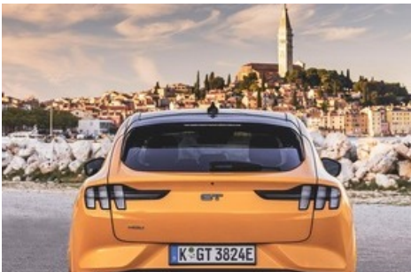
Ford Mustang Mach-E GT / Weiterer Text über ots und www.presseportal.ch/de/nr/100000451 / Die Verwendung dieses Bildes ist für redaktionelle Zwecke honorarfrei.