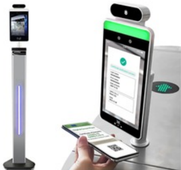
UMTS Covid-Doorman 1- Mit Standfuß