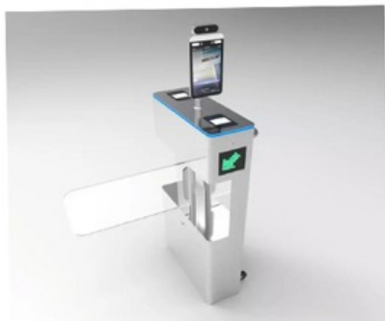
UMTS Covid-Doorman 3 - Mit Drehtür