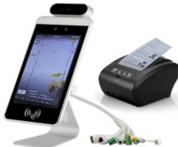
UMTS Covid-Doorman 2 - Mit Labeldrucker