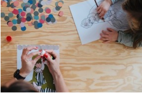
BILD zu OTS - Bastelblock für Kinder und Jugendliche