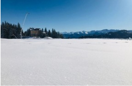
Pardiel mit Blick in Richtung Prodkopf

Diese Meldung kann unter https://www.presseportal.ch/de/pm/100085818/100880856 abgerufen werden.