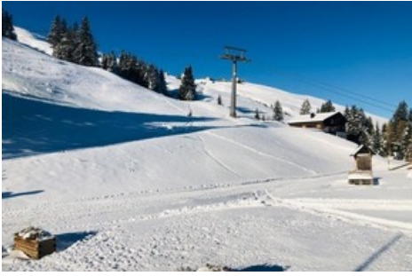
Aussicht in Richtung Berg auf Pardiel