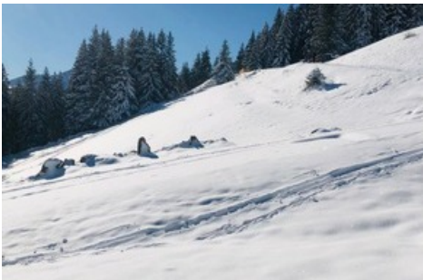
Blick von Pardiel in Richtung Graubünden