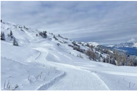
Erster Schnee auf Pardiel