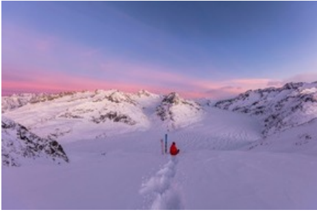
Erlebe befreiende Momente am Grossen Aletschgletscher - dies das Markenversprechen der Aletsch Arena. In einem Wort ausgedrückt: BEFREIEND