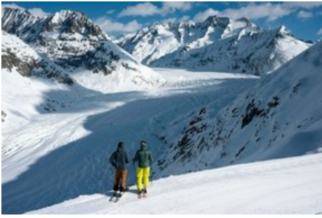
Wintersaisonstart in der Aletsch Arena 8.12.2021 - zwischen Sicherheit und möglichst viel Freiheit