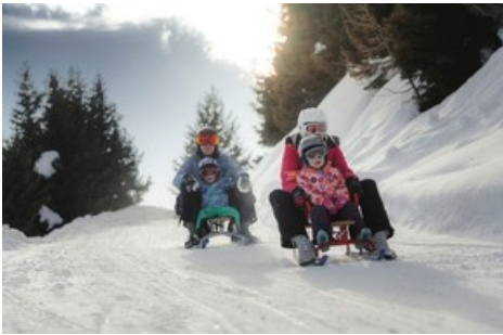
Das temporeiche Erlebnis auf dem Schlittelweg Moosfluh, der Schlittelpiste Blätz oder der Schlittelabfahrt Fiescheralp-Lax mit 11 km! ist ein Spass für die ganze Familie. aletscharena.ch/schlitteln