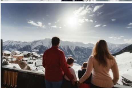
Die Aletsch Arena ist eine Familien-Skidestination. Ski in - Ski out: vom Chalet geht's direkt ab auf die Piste. aletscharena.ch/familien