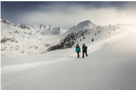
Beim Winterwandern auf 72 Kilometer Winterwanderwegen können Gäste die wohlige Ruhe der Aletsch Arena geniessen. aletscharena.ch/winterwandern