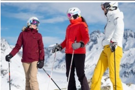
Die Aletsch Bahnen fördern den Wintersport: "Schgii fer frii" jeden Samstag fahren Kinder und Jugendliche bis 20 Jahre kostenlos Ski. aletscharena.ch/samstag-ski