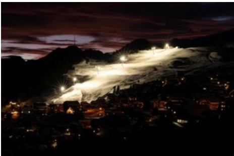
Die gute Nachricht für jene Gäste, denen ein Skitag zu kurz ist: einmal wöchentlich findet auf der Riederalp, der Bettmeralp und im Fieschertal Nachtskifahren statt. Dies auf gut ausgeleuchteten Pisten. aletscharena.ch/nachtskifahren

Diese Meldung kann unter https://www.presseportal.ch/de/pm/100070233/100881200 abgerufen werden.