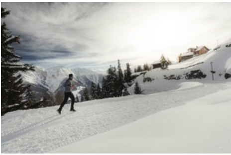
Die Aletsch Arena bietet 72 Kilometer präparierte Trails im Winter. Die Aletsch Arena am Grossen Aletschgletscher ist ideal für Trailrunning. aletscharena.ch/trailrunning