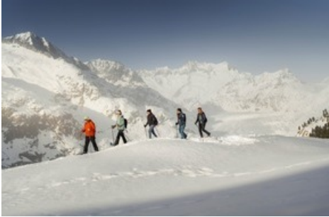
Schneeschuhlaufen – durch die Stille des Winters 2020 erhielt die Aletsch Arena die Auszeichnungen als «Best Ski Resort» in der Kategorie «Ruhe und Erholung». aletscharena.ch/schneeschuhlaufen