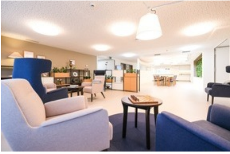
Viva Luzern Rosenberg - Wohnbereich

Diese Meldung kann unter https://www.presseportal.ch/de/pm/100071669/100881943 abgerufen werden.