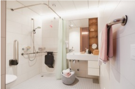
Viva Luzern Rosenberg - Bad