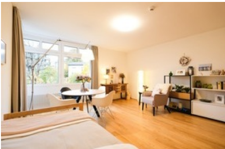
Viva Luzern Rosenberg - Einzelzimmer