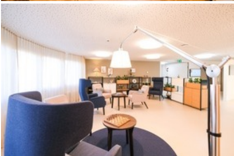
Viva Luzern Rosenberg - Wohnbereich