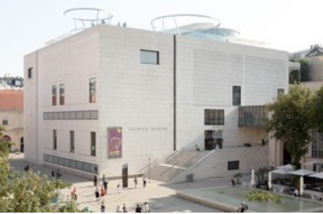
BILD zu OTS - Leopold Museum mit MQ Libelle auf dem Dach des Leopold Museum

Diese Meldung kann unter https://www.presseportal.ch/de/pm/100015167/100881987 abgerufen werden.