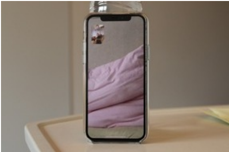
BILD zu OTS - Wolfgang Tillmans Lüneburg (self), 2020

Diese Meldung kann unter https://www.presseportal.ch/de/pm/100056299/100882529 abgerufen werden.