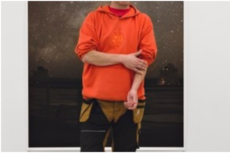
BILD zu OTS - Porträt: Wolfgang Tillmans in der Ausstellung "Schall ist flüssig"