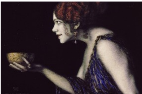
BILD zu OTS - Franz von Stuck, Tilla Durieux als Circe in dem gleichnamigen Stück von Pedro Calderón de la Barca, 1912. Öl auf Holz, 60 x 68 cm. Staatliche Museen zu Berlin, Nationalgalerie/Leihgabe der Bundesrepublik Deutschland.