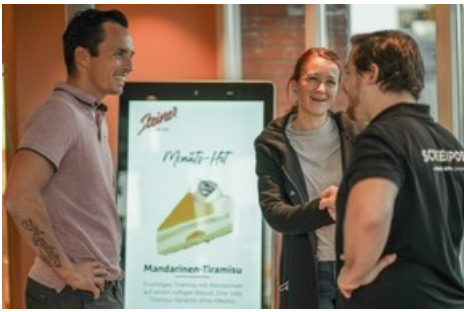
Lieferung Screenpose bei Steiner Beck AG / Weiterer Text über ots und www.presseportal.ch/de/nr/100074662 / Die Verwendung dieses Bildes ist für redaktionelle Zwecke honorarfrei.