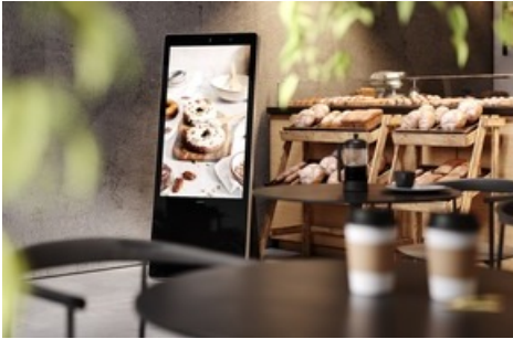
Screenpose Szenerie / Weiterer Text über ots und www.presseportal.ch/de/nr/100074662 / Die Verwendung dieses Bildes ist für redaktionelle Zwecke honorarfrei.

Diese Meldung kann unter https://www.presseportal.ch/de/pm/100074662/100882977 abgerufen werden.