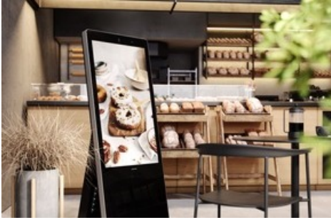
Screenpose Szenerie / Weiterer Text über ots und www.presseportal.ch/de/nr/100074662 / Die Verwendung dieses Bildes ist für redaktionelle Zwecke honorarfrei.