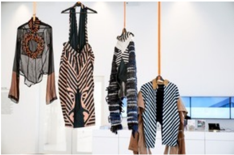
Schwebende Körper, Rafael Kouto.