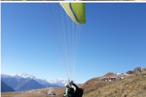
Ursula Sass beim Gleitschirmflug