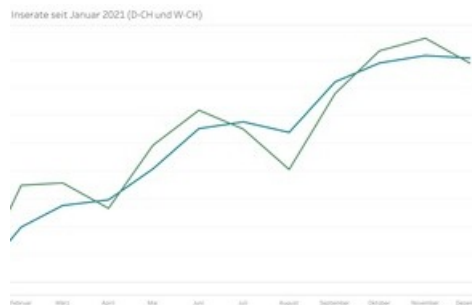
+40% des Stellenvolumens zwischen Januar und Dezember 2021