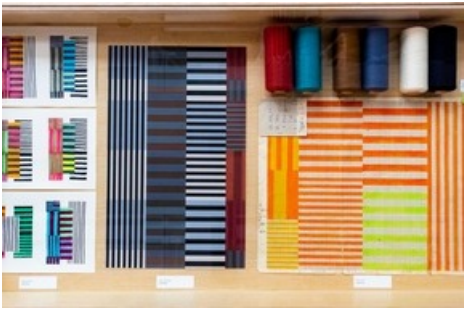
Vitrine Textilmuseum St.Gallen 11.3. - 18.9.2022