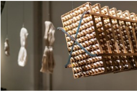
Kibiso Criss Cross - Ausstellungsinstallation Textilmuseum St.Gallen 11.3. - 18.9.2022