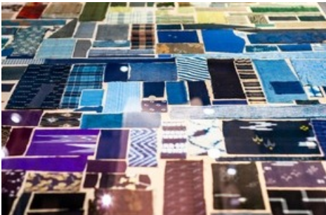
Kimono Collage - historische Textilien aus Japan Textilmuseum St.Gallen 11.3. - 18.9.2022