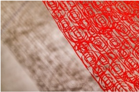
Paper Role - Aetzstickerei Textilmuseum St.Gallen 11.3. - 18.9.2022