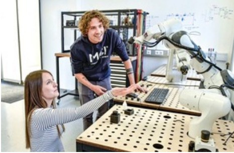
BILD zu OTS - Das Mechatronik Studium beschäftigt sich mit aktuellsten Themen.

Diese Meldung kann unter https://www.presseportal.ch/de/pm/100012712/100886165 abgerufen werden.