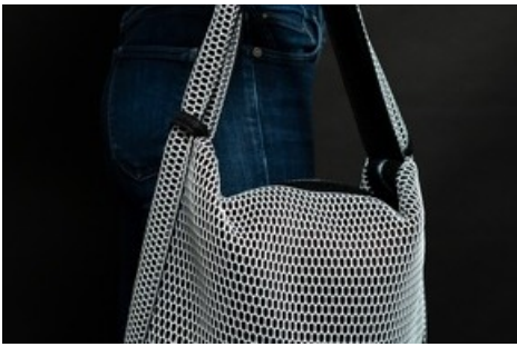
Der multifunktionale, clevere Bag kann als Shopper oder als Rucksack getragen werden. Nähdauer: 4h / Level: mittel