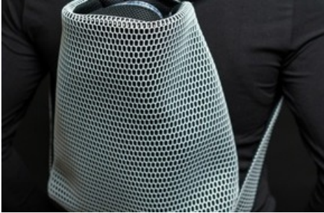
Der multifunktionale, clevere Bag kann als Shopper oder als Rucksack getragen werden. Nähdauer: 4h / Level: mittel