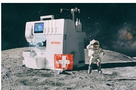
Die Zukunft des Nähens im BERNINA Space Lab