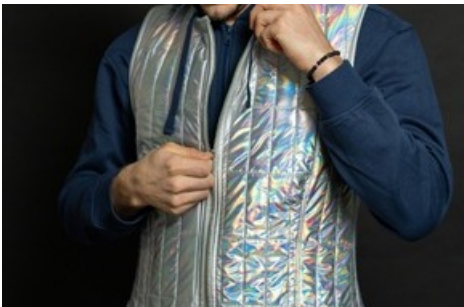
Die windfeste und reflektierende Weste ist aus leichtem Material und ideal in der Übergangszeit. Nähdauer: 4h / Level: einfach