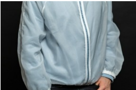
Die ultraleichte Jacke ist wasserabweisend, windfest und transparent mit Reflektoren für bessere Sichtbarkeit im Strassenverkehr. Nähdauer: 6h / Level: mittel – fortgeschritten