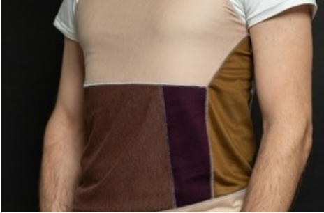
Das Upcycling T-Shirt ist ein echtes Unikat und besteht aus hochstehenden Jersey-Stoffresten. Nähdauer: 4h / Level: mittel

Diese Meldung kann unter https://www.presseportal.ch/de/pm/100019087/100886176 abgerufen werden.