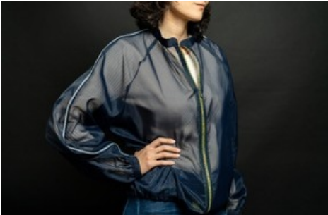
Die ultraleichte Jacke ist wasserabweisend, windfest und transparent mit Reflektoren für bessere Sichtbarkeit im Strassenverkehr. Nähdauer: 6h / Level: mittel – fortgeschritten