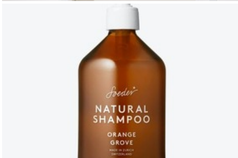
Die typischen dunkelbraunen Flaschen von Soeder sind bewusst robust und können beliebig oft wieder aufgefüllt werden, neu auch im Unterengadin.

Diese Meldung kann unter https://www.presseportal.ch/de/pm/100018582/100886587 abgerufen werden.