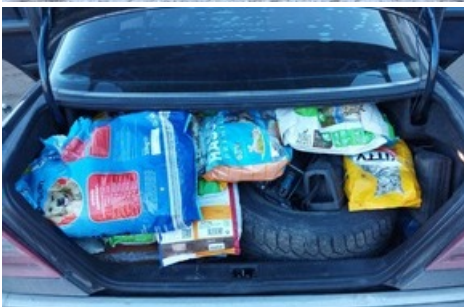
VIER PFOTEN und Partner leisten Hilfe für Tierheime in der Ukraine.