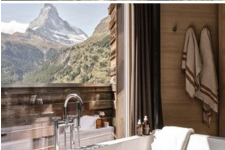
Aussicht aus dem Cervo Mountain Resort in Zermatt