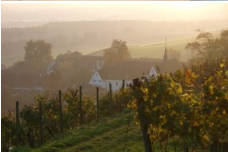
Das Hotel Kartause in Ittingen

Diese Meldung kann unter https://www.presseportal.ch/de/pm/100088995/100886804 abgerufen werden.