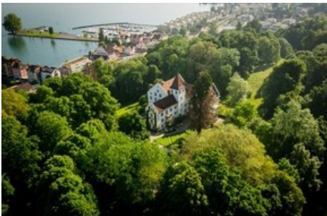
Schloss Wartegg am Rorschacherberg