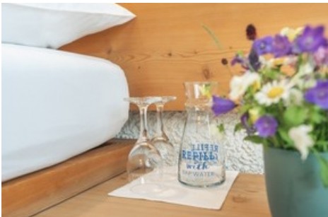
Das Hauser Hotel in St. Moritz verkauft hauseigenes Trinkwasser