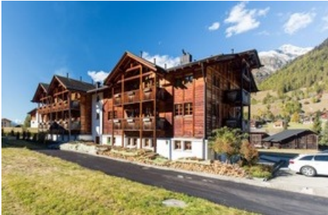
Hotel Glocke in Reckingen