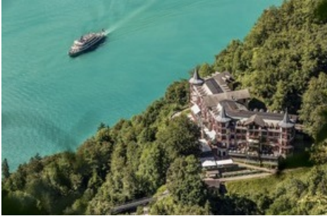
Grandhotel Giessbach in Brienz