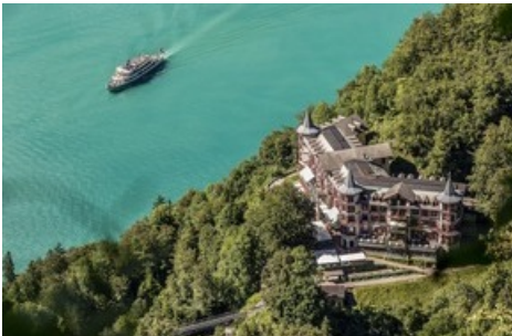
Das Grandhotel Giessbach am Brienzersee wird seit 1949 mit der Kraft der Giessbachfälle gespeist