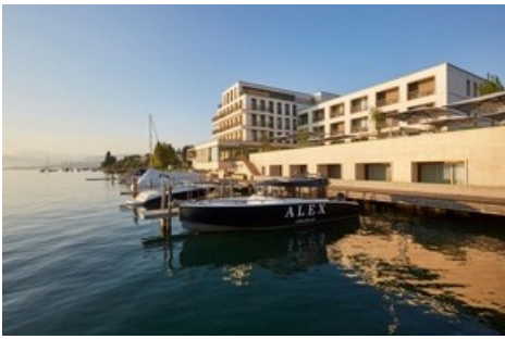
Hotel Alex Lake am Zürichsee