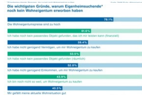
Die wichtigsten Gründe, warum Eigenheimsuchende noch kein Wohneigentum erworben haben

Diese Meldung kann unter https://www.presseportal.ch/de/pm/100018827/100886979 abgerufen werden.