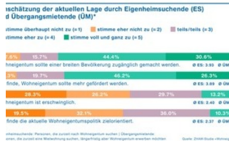
Einschätzung der aktuellen Lage durch Eigenheimsuchende und Übergangsmietende