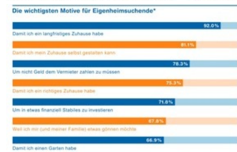
Die wichtigsten Motive für Eigenheimsuchende