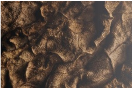
Getrocknete Blätter Tabak / Nachtschatten Verlag