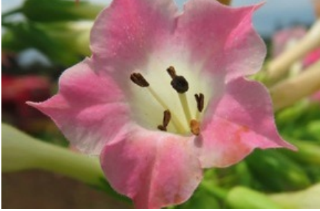
Blüte Tabak Nicotiana tabacum / Nachtschatten Verlag