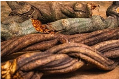
Ayahuasca Zutat Banisteriopsis-caapi -Liane / Nachtschatten Verlag