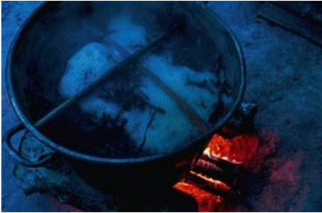
Zubereitung von Ayahuasca-Sud / Nachtschatten Verlag