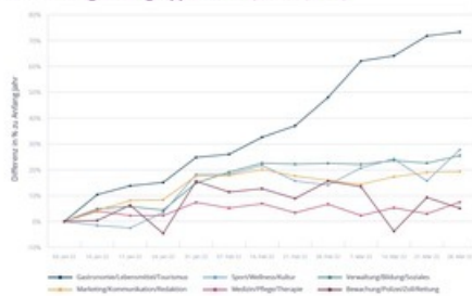
Entwicklung Berufsgruppen im 1. Quartal (D-CH)